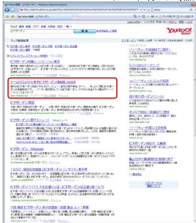
Yahoo!「ビアガーデン」検索 (2009年5月21日時点)

アクセスの大半は検索エンジン経由で、夕方4～6時頃がピーク。 その他掲示板サイトやブログランキングなどから。