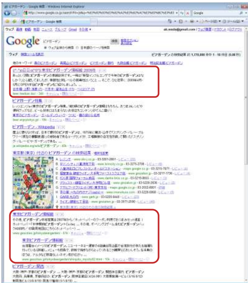
Google「ビアガーデン」検索 (2009年5月21日時点)

アクセスの大半は検索エンジン経由で、夕方4～6時頃がピーク。 その他掲示板サイトやブログランキングなどから。